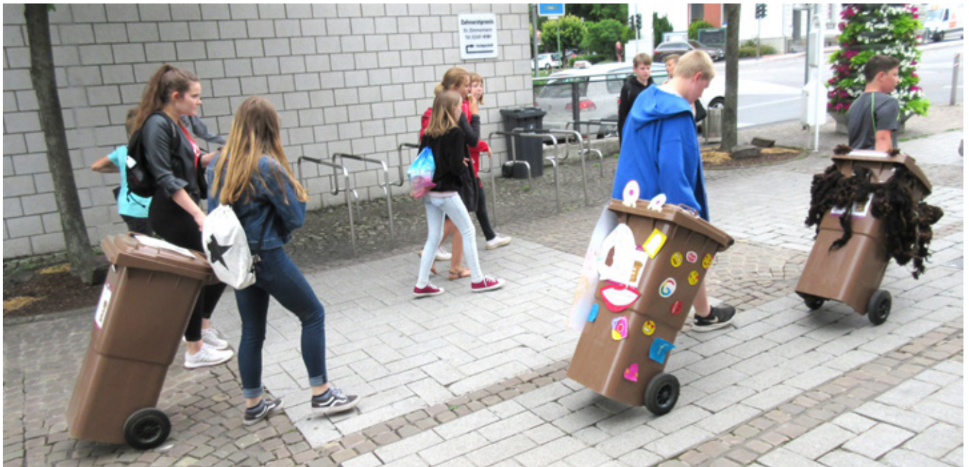
Auf dem Weg zum Ausstellungsaufbau

Über die künstlerische Auseinandersetzung werden die Teilnehmenden aktiv, und über das selbstbestimmte Schaffen schärft sich das Bewusstsein für das Thema. Die Abfallwirtschaftsbetriebe des Landkreises Altenkirchen unterstützen das Projekt. Eine Präsentation der künstlerischen Arbeiten fand im Juni 2018 bei der Eröffnung des neuen Besucherzentrums der AWB statt.